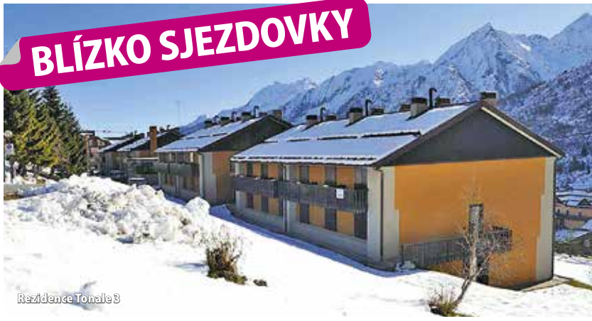
Rezidence Tonale 3