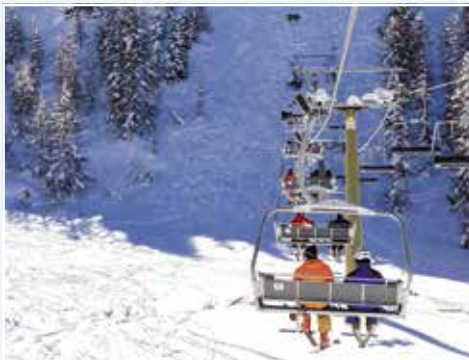
SKIPAS DOLOMITI SUPERSKI viz. str. 25

při zakoupení skipasu s minimální platností 4 dny vzniká nárok na 1 den lyžování ZDARMA!